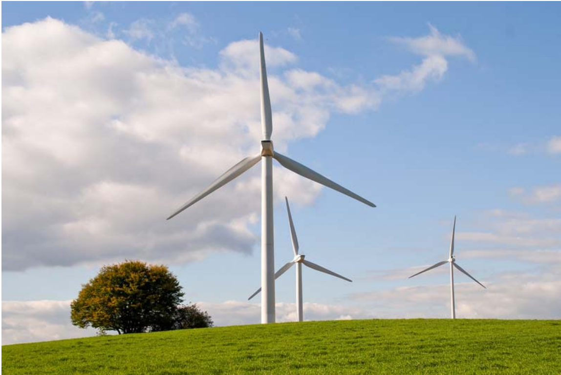
Kühntaler Windräder mit behäbiger Drehzahl – ganz anders bei den BTN-Cracks!