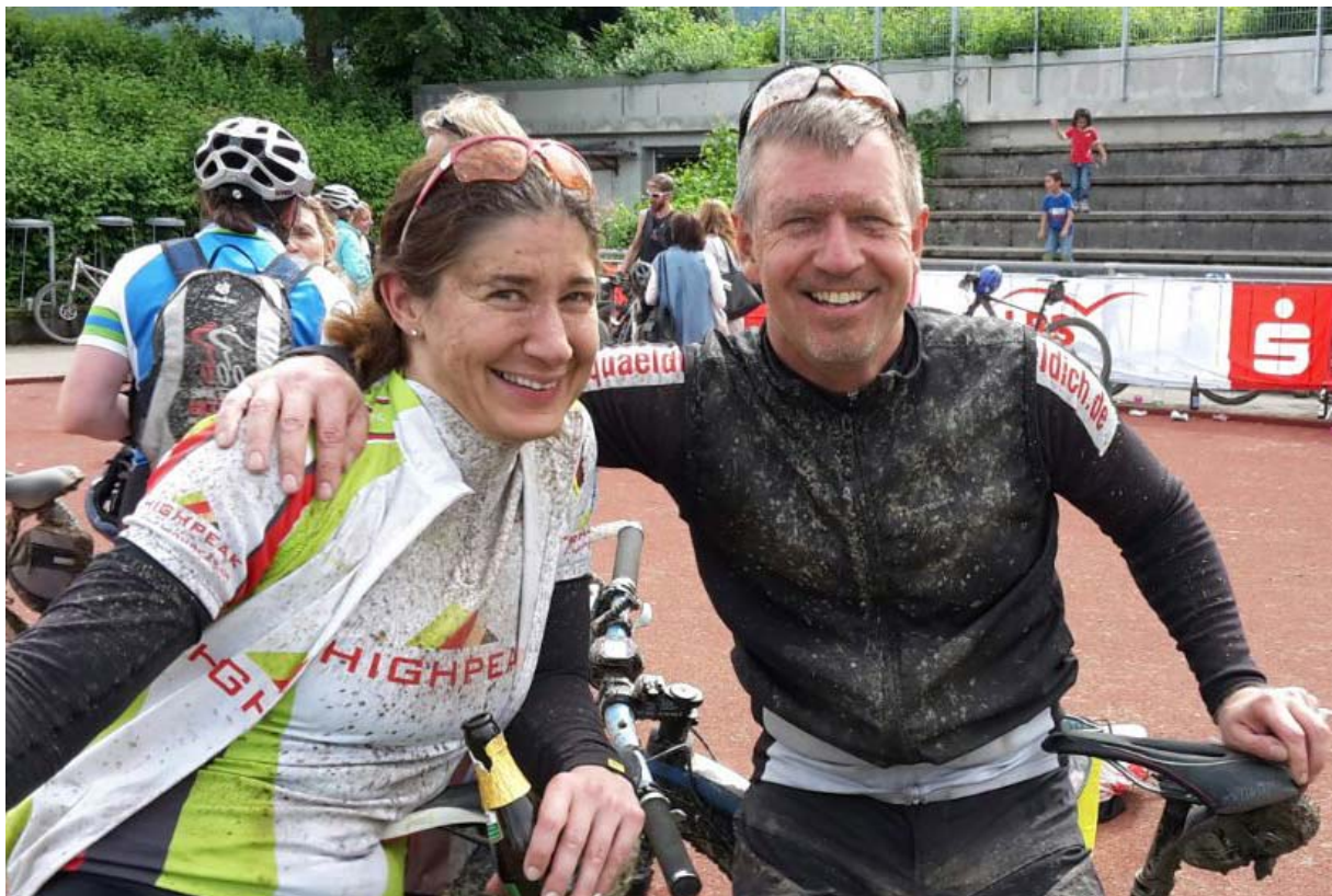
Finisher – Black Forest Ultra ☺