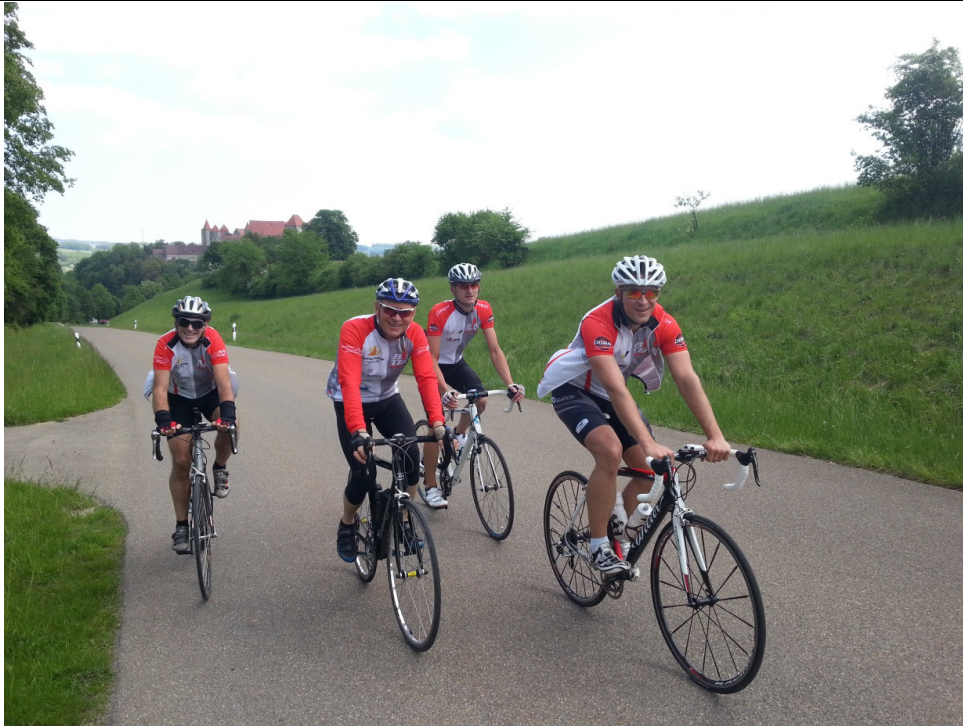
Auf der Harburg-Rennstrecke „Pack den Bock“ (s. dazu http://www.tsvharburg-triathlon.de/termine/pack-den-bock/ )