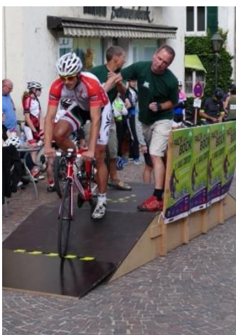
Start! (-hilfe) beim Pack-den-Bock